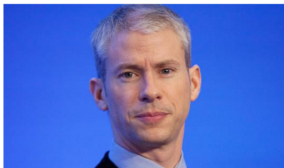
Franck Riester Ministre de la Culture

Le ministère de la Culture conduit la politique de sauvegarde, de protection et de mise en valeur du patrimoine culturel, favorise la création des œuvres de l'art et de l'esprit et le développement des pratiques et des enseignements artistiques. Il participe à la mise en œuvre de la politique du Gouvernement concernant les technologies, les supports et les réseaux utilisés dans le domaine des médias.