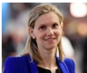
Agnès Pannier-Runacher Secrétaire d'État auprès du ministre de l'Économie et des Finances