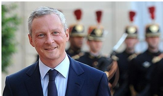
Bruno Le Maire Ministre de l'Économie et des Finances