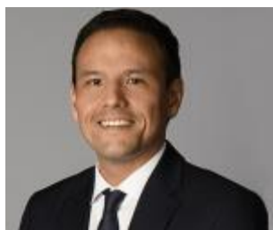
Cédric O Secrétaire d'État auprès du ministre de l'Économie et des Finances et du ministre de l'Action et des Comptes publics, chargé du Numérique