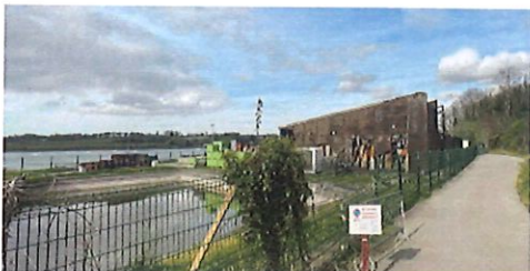
VUE OUD-OUEST - ETAT INITIAL (APRES SINISTRE)