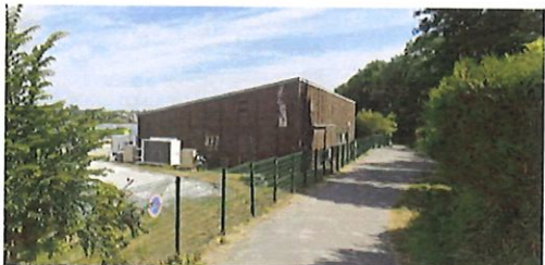
VUE OUD-OUEST - ETAT INITIAL (AVANT SINISTRE)