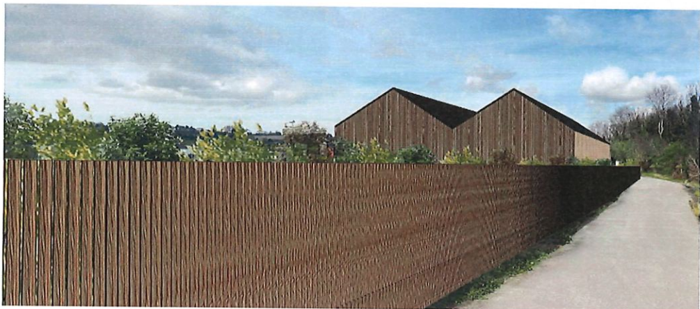
VUE OUD-OUEST - ETAT PROJETE